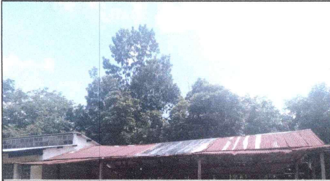
Foto1: Sustitucion de lamina se encuentra en mal estado